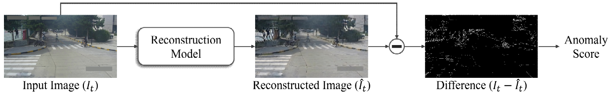
그림 1. 대표적인 준지도학습 복원 기반 이상 감지 프레임워크 Fig. 1. Representative semi-supervised anomaly detection framework using reconstruction